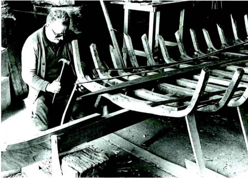
Calafat de Catarroja. 1983.

tasques bàsiques d'extracció i reproducció dels recursos, especialment l'agricultura, sinó que basaven la seua existència, econòmicament parlant, en la producció d'elements necessaris per a la realització d'aquestes activitats.