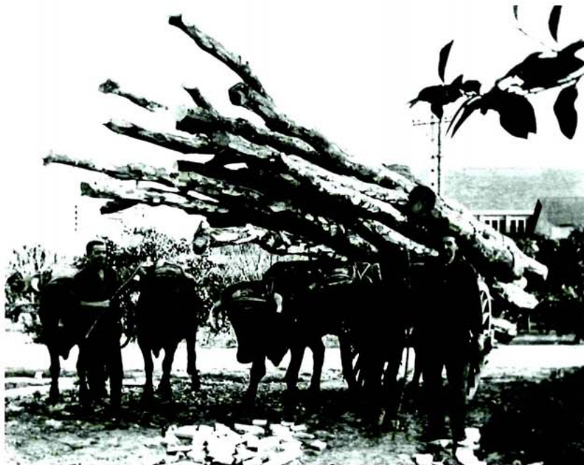
Transport de troncs. Arxiu Alzira. AF. MUPCVA.

Fins ací hem fet referència exclusivament als oficis relacionats amb l'elaboració de productes de la fusta dels quals el MUPCVA té referència en les seues col·leccions. Això no obstant, i com ja hem indicat prèviament, la variabilitat pro-