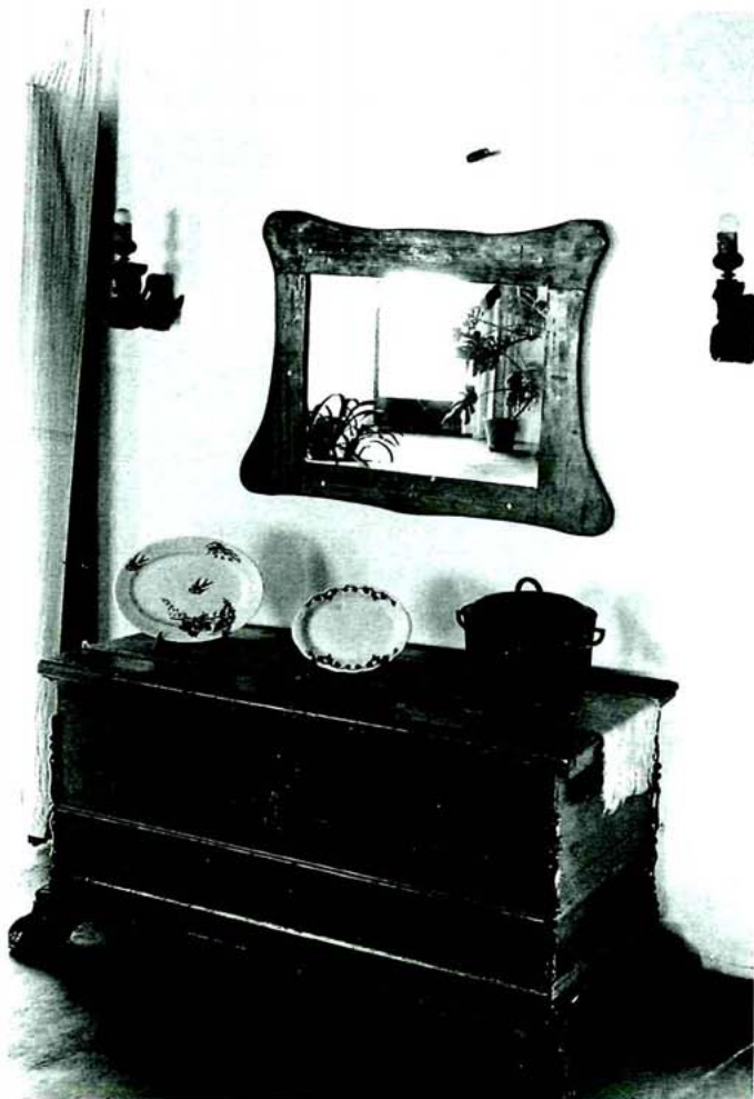
Mobiliari tradicional. Casa a Potries (la Safor), 1981. AF. MUPCVA.

Aladrers: a pesar que prenen el seu nom d'un dels objectes emblemàtics de l'activitat agrària, l'aladre, el ben cert és que solien realitzar altres instruments, com ara taules planes, taules de ganxos, pales, carros per al transport de garbes d'arròs, rastells, etcètera. En una societat de base agrícola és fàcil endevinar l'extraordinària importància d'aquest tipus de professionals. No obstant això, el seu declivi s'inicià en el moment en què es va produir la generalització de l'ús del ferro en aquest tipus d'instrumental i especialment amb l'arribada dels aladres metàl·lics d'origen industrial.