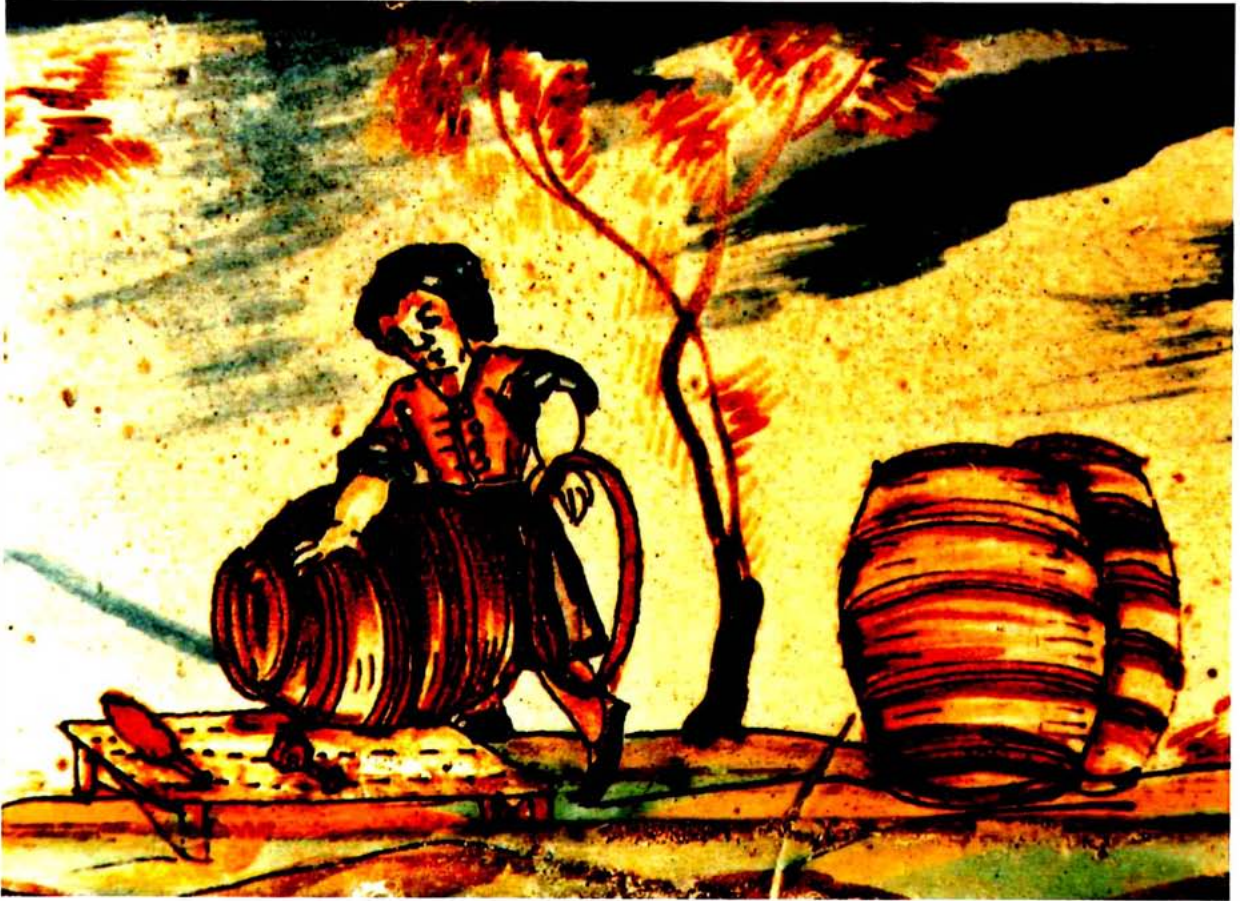
Boter. Plafo ceràmic. Arxid Gil Carles. AF. MUPCVAS