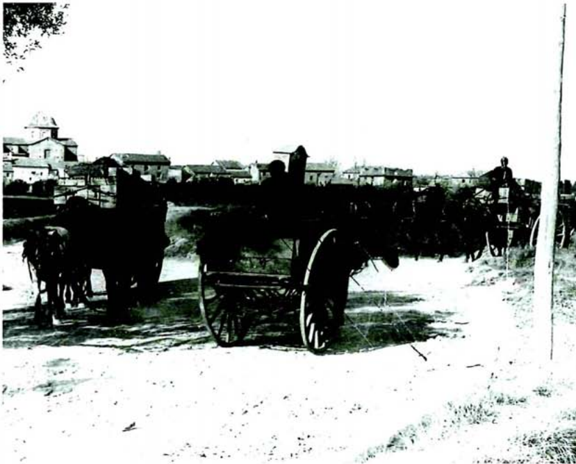
Carros transportant caixes, anys vint

fessional dels fusters era molt més àmplia. Vegem-ne alguns exemples: