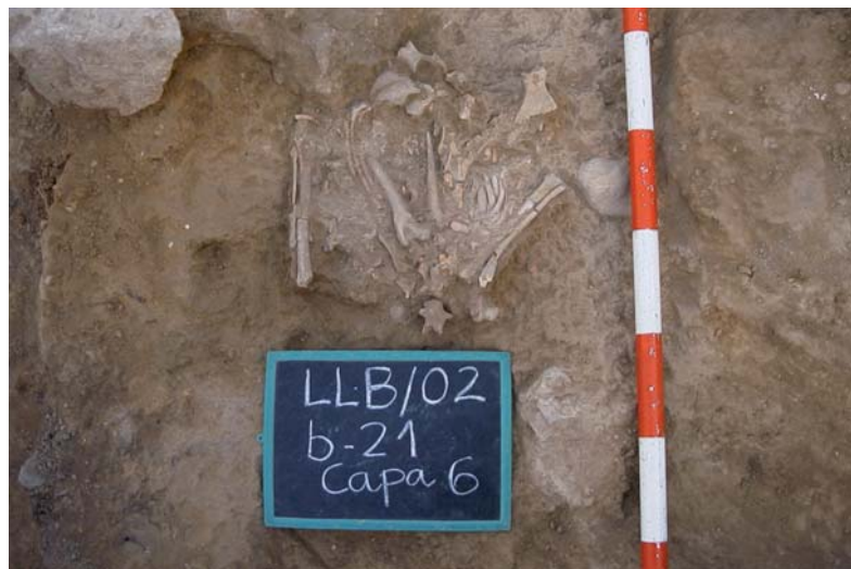
Figura 1. Inhumació secundària en el sector E de la Loma de Betxí, i restes d'un cànid associades a l'enterrament.

Oliva (Cuesta et al., 2002), corresponent a un individu adult, de sexe femení, amb crani d'aspecte gràcil, que presenta una lesió en la volta craniana i patologies odontològiques, com càries, que fan pensar en una dieta relativament blana, rica en hidrats de carboni, en què destaca el desgast de les dents anteriors, tant superiors com inferiors, indicatiu d'algun hàbit parafuncional selectiu de les dents anteriors per a ús instrumental, com el mossegament d'objectes sense finalitat alimentària, etc.