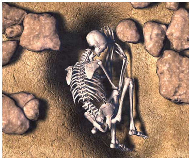
Figura 2. Enterrament en fossa del Sector O de la Lloma de Betxí i reconstrucció.

ció del lligament costoclavicular, entesopatia en la tuberositat radial d'ambdós radis i entesopatia en falanges de les mans. La datació obtinguda per a aquesta segona sepultura és de 3400 \pm 40 BP, calibratge a 2\sigma entre 1760 i 1610 cal aC.