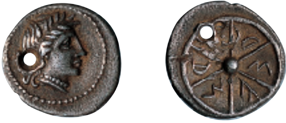
Dracma d'Arse. Mitjan segle III a. C. Ø 15 mm. Dracma de Arse. Mediadós siglo III a. C. Ø 15 mm.