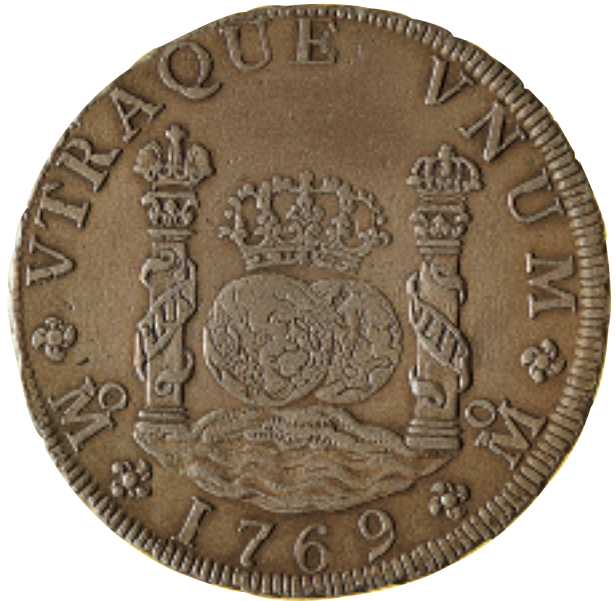
8 rals columnaris de Carles III. Mèxic (1769). Ø 39 mm. 8 reales columnarios de Carlos III. Méjico (1769). Ø 39 mm.