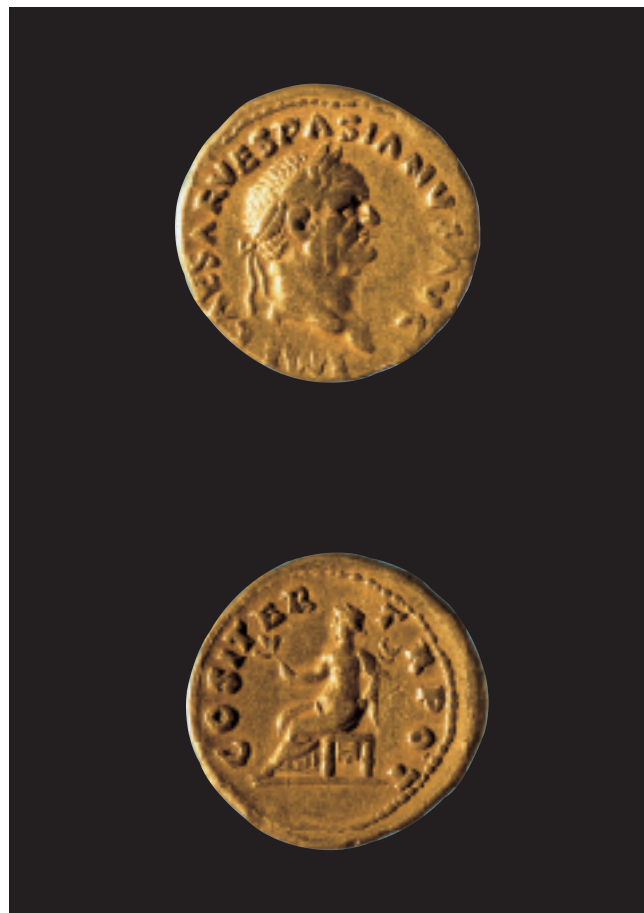
Auri de Vespasià (69-79 d. C.) trobat a l'Arc de Cabanes (Castelló). Ø 18 mm. Aureo de Vespasiano (69-79 d. C.) hallado en el Arc de Cabanes (Castelló). Ø 18 mm.