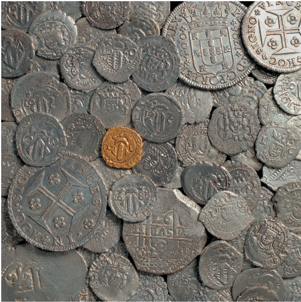
Tresor trobat al carrer de Fos, València Tesoro hallado en la C/ Fos, de Valencia.