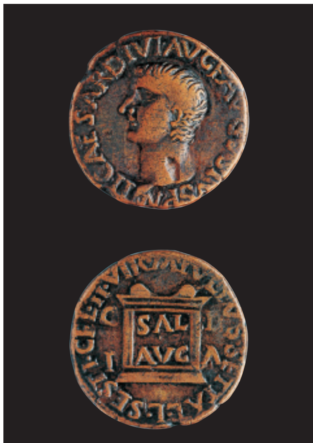
As de Tiberi (14-37 d. C.), encunyat a la colònia d'Ilici. Ø 28 mm. As de Tiberio (14-37 d. C.), acuñado en la colonia de Ilici. Ø28 mm.

Tras las guerras civiles del siglo I a.C. fue cuando se produjo en Hispania un fuerte empuje en el proceso de fundación de colonias y de municipios. Desde entonces la moneda se fue convirtiendo en un objeto fundamental en la vida de las ciudades y de allí se extendió su uso al medio rural. Algunas de las antiguas ciudades como Saguntum continuaron acuñando moneda en época imperial, mientras que otras, fundadas recientemente, iniciaron sus emisiones como la colonia latina de Ilici. Las monedas puestas en circulación por Saguntum e Ilici —las únicas cecas valencianas en funcionamiento— no debieron ser suficientes para abastecer las necesidades locales y, por ello, ejemplares acuñados en Carthago Nova y en algunos talleres del valle del Ebro, como Calagurris, Celsa o Caesaraugusta, debieron compartir la circulación en los mercados. Las monedas acuñadas en las ciudades romanas de Hispania, a pesar de que fueron las monedas mayoritarias durante la di-