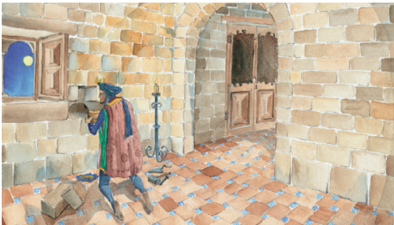
Recreació de l'amagatall d'un tresor. / Recreación del escondite de un tesoro.