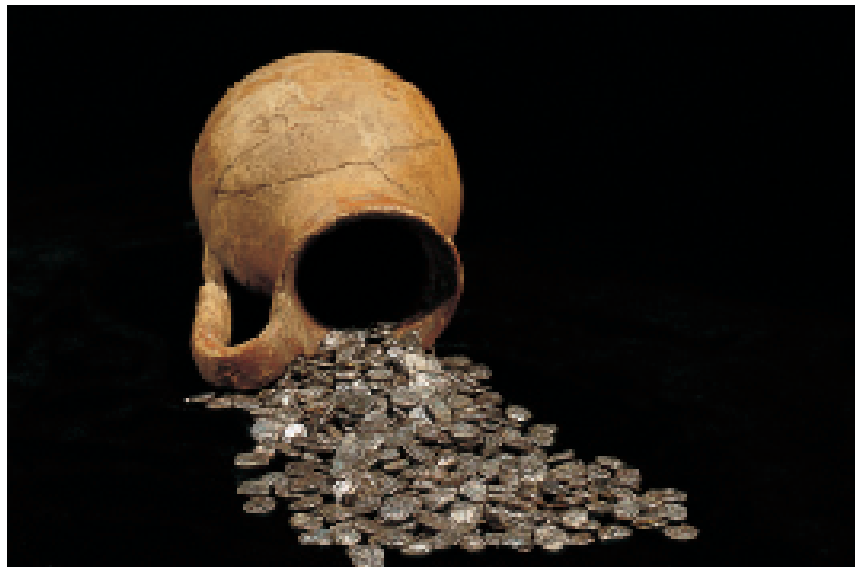
Tresor d'Empúries. 1926. Fraccionàries empuritanes (GNC). Tesoro de Ampurias. 1926. Fraccionarias ampuritanas (GNC).