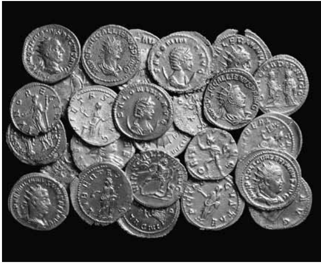
Tresor de les Alqueries (una part). Tesoro de Les Alqueries (una parte).