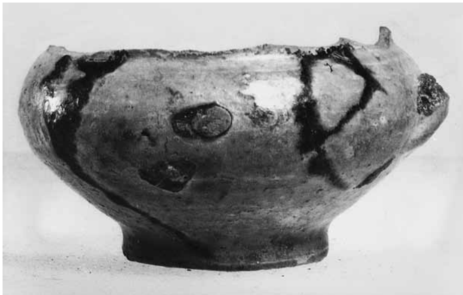
Recipient que contenia el tresor de les Suertes. Recipiente que contenía el tesoro de las Suertes.