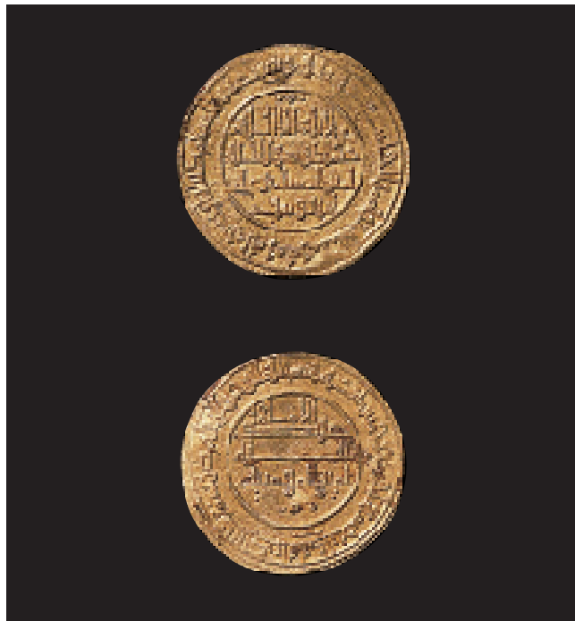
Dinar almoràvit de la seca de Dénia. Ø 25 mm. Dinar almoràvide de la ceca de Denia. Ø 25 mm.