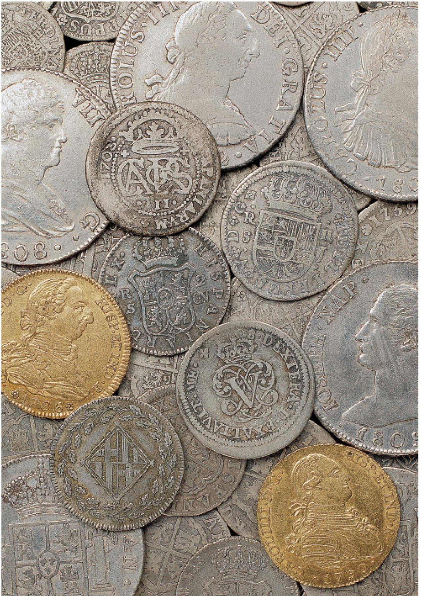
Tresor de Sant Joan. / Tesoro de Sant Joan.