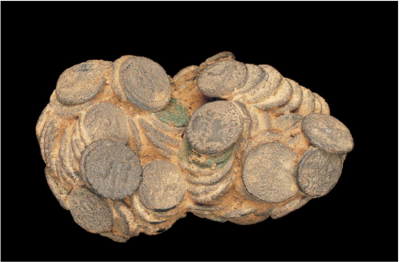
Estat de conservació del tresor del carrer del Salvador en el moment del seu trobament. Estado de conservación del tesoro de la calle Salvador en el momento de su hallazgo.