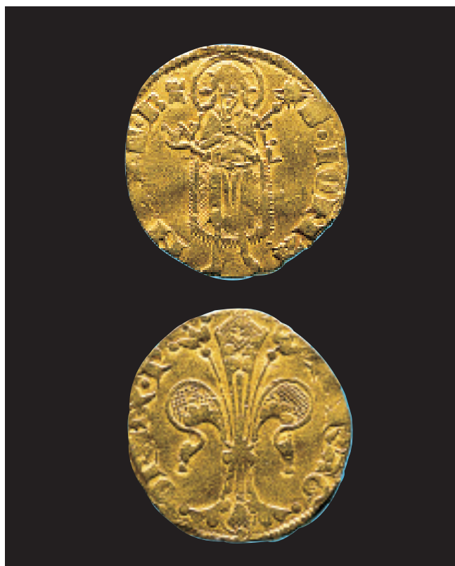
Florí de Pere el Cerimoniós (1336-1387). València (GNC) Ø 19 mm. Florín de Pere el Cerimoniós (1336-1387). València (GNC) Ø 19 mm.

En el siglo XIV ante la pérdida de fuerza de las divisas árabes y bizantinas empezaron a tener relevancia las monedas de oro que las potencias comerciales europeas comenzaron a emitir en el siglo XIII. La Corona de Aragón, inmersa en el mundo mediterráneo donde predominaban el florín de Florencia y el ducado de Venecia, terminó adoptando estos patrones para sus emisiones áureas. La acuñación de moneda de oro se había hecho imprescindible tanto por el aumento del volumen de negocios como por la necesidad de financiar los numerosos conflictos bé-