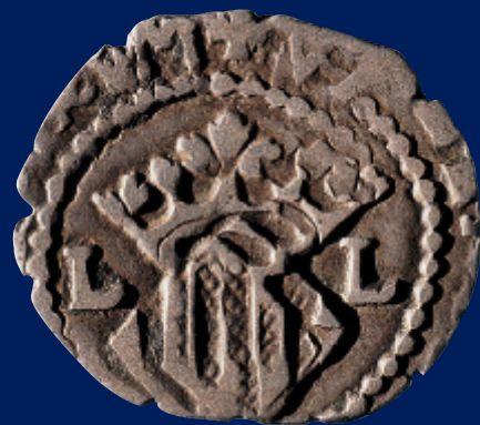
Dihuité de l'arxiduc Carles. València (1706). / Dihuité del archiduque Carlos. Valencia (1706). Ø 18 mm.