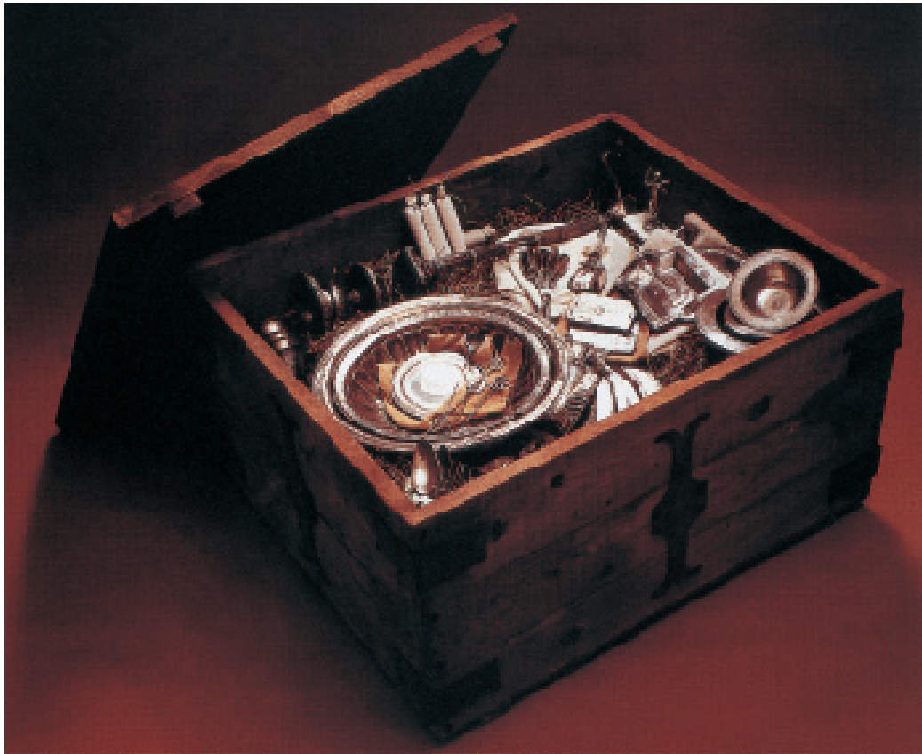
Restitució de la forma en què es degué ocultar el tresor romà de Kaiseraugust (Römermuseum Augst). Restitución de la forma en la que se debió ocultar del tesoro romano de Kaiseraugust (Römermuseum Augst).