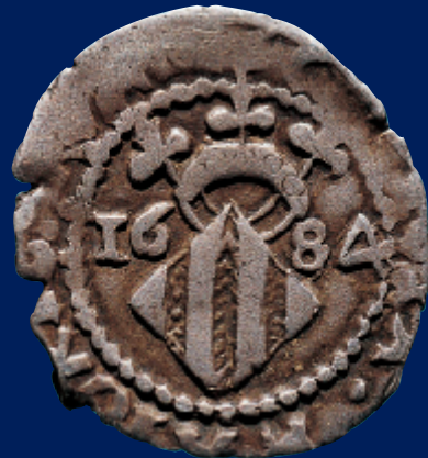
Dihuité de Carles II. València (1684). Ø 18 mm./ Dihuité de Carlos II. Valencia (1684). Ø 18 mm.