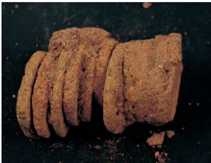
Depòsit monetar de Romeu tal com es trobà a l'excavació. Depósito monetar de Romeu tal como se encontró en la excavación.