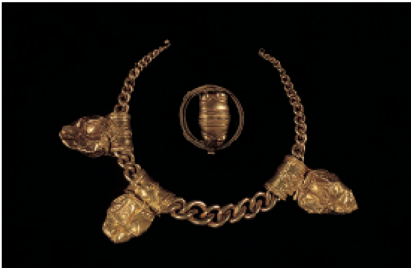
Joyes aparegudes al tresor de la Safa, a Xest. Joyas aparecidas en el tesoro de La Safa, en Chestre.