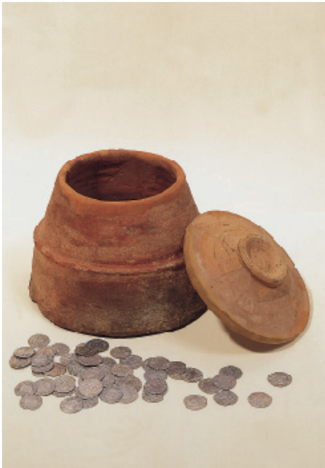
Recipient i algunes monedes del tresor del carrer de la Llibertat després de la restauració. Recipiente y algunas monedas del tesoro de la calle Llibertat después de la restauración.