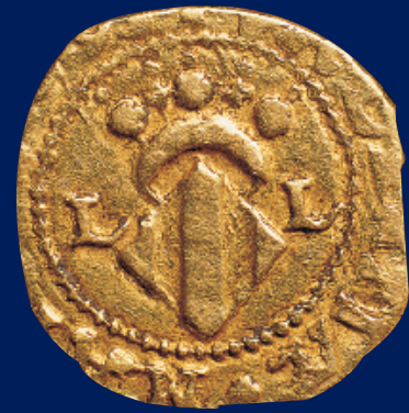
Escut de Carles II. València. Tresor del carrer de Fos. Ø 16 mm./ Escudo de Carlos II. Valencia. Tesoro de la calle Fos. Ø 16 mm.