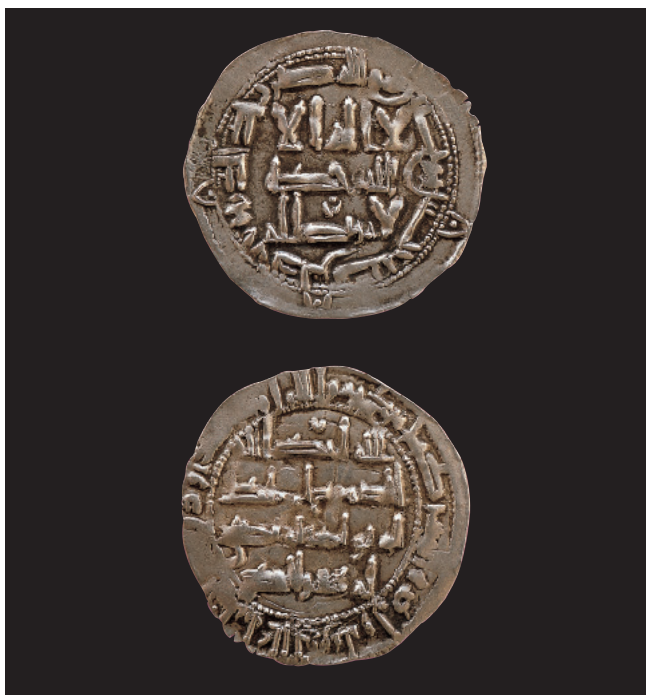
Dirham d'Al-Hakim I. Al-Andalus (202 H). Tresor de Borriana. Ø 28 mm. Dirham de al-Hakim. Al-Andalus (202 H). Tresor de Borriana. Ø 28 mm.

También circulaban fulus de cobre pero sólo se atesoraba la plata. Los tesoros de este período son un buen ejemplo del grado de presencia del estado omeya en los distintos territorios, ya que la mayor parte de ellos han sido encontrados en la zona de Andalucía, mientras que en las tierras valencianas