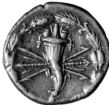
Denari romano-republicà emés per Q. Maximus. Roma (127 a.C.). Ø 19 mm.