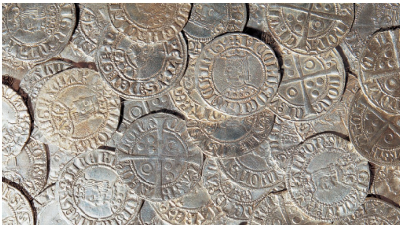
Tresor del carrer de la Llibertat. Tesoro de la calle Libertad.