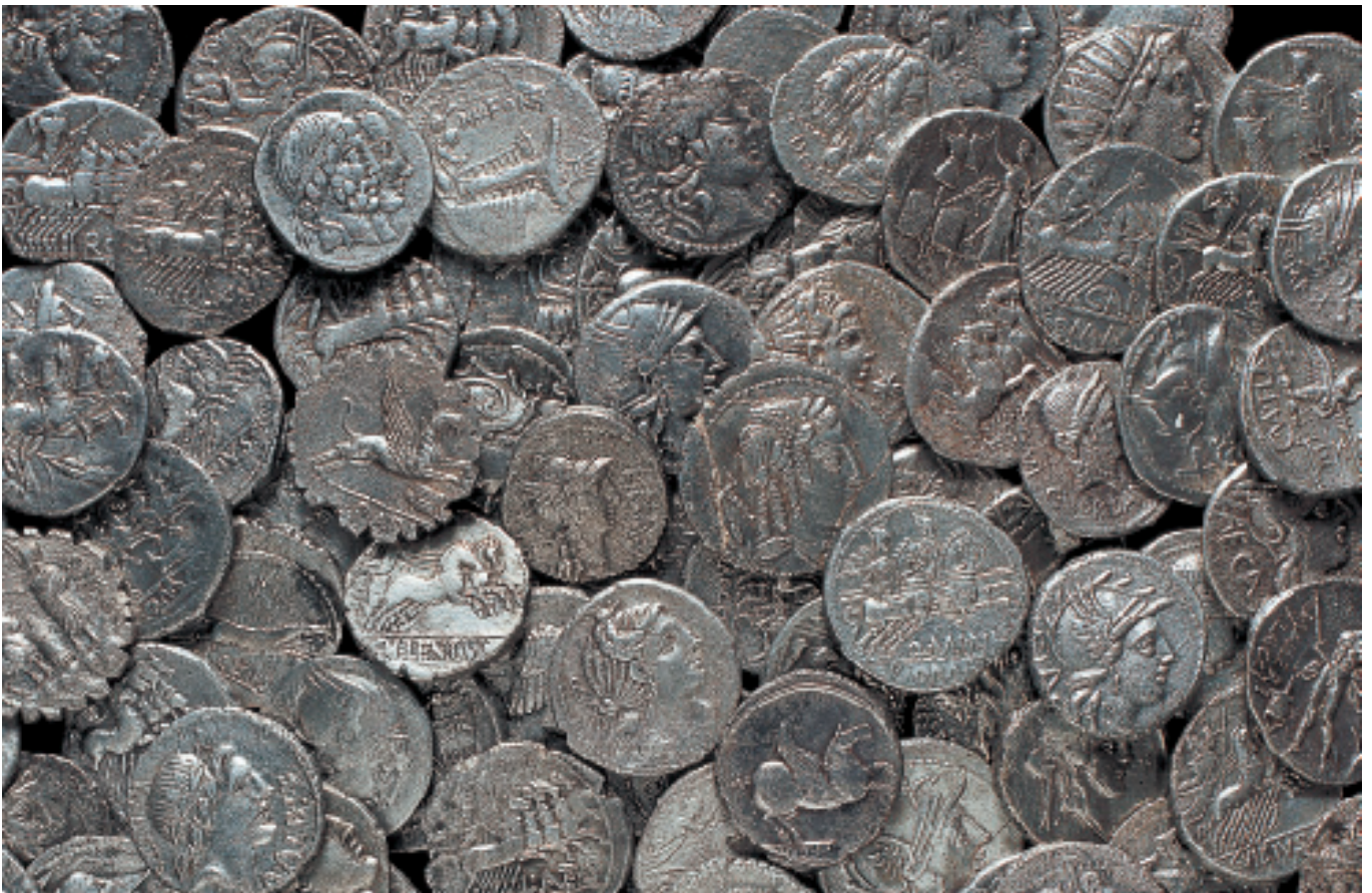
Tresor del carrer del Salvador després de la restauració. Tesoro de la calle Salvador después de su restauración.