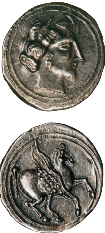
Dracma ibèrica de imitació emporitana. Tresor d'Orpesa. Ø 20 mm. Dracma ibèrica de imitació emporitana. Tesoro de Orpesa. Ø 20 mm.

quen en presència les que encunyaren els pompeians.