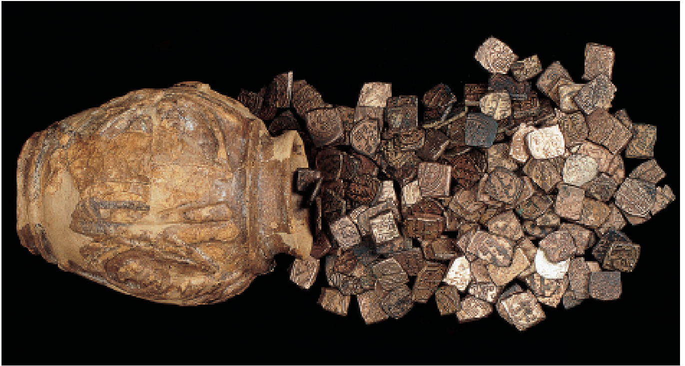
Tresor de Benicàssim Tesoro de Benicàssim