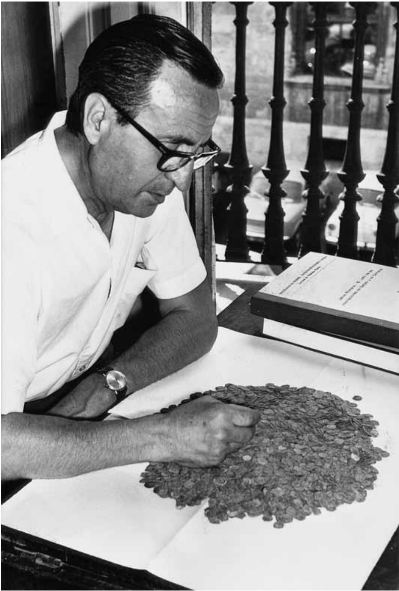
Domingo Fletcher Valls, director del SIP i del Museu de Prehistòria de València el 1971, fent el recompte de les monedes del tresor de Riba-roja de Túria. Domingo Fletcher Valls, director del SIP y del Museo de Prehistoria de València, en 1971, contando las monedas del tesoro de Riba-roja de Túria.