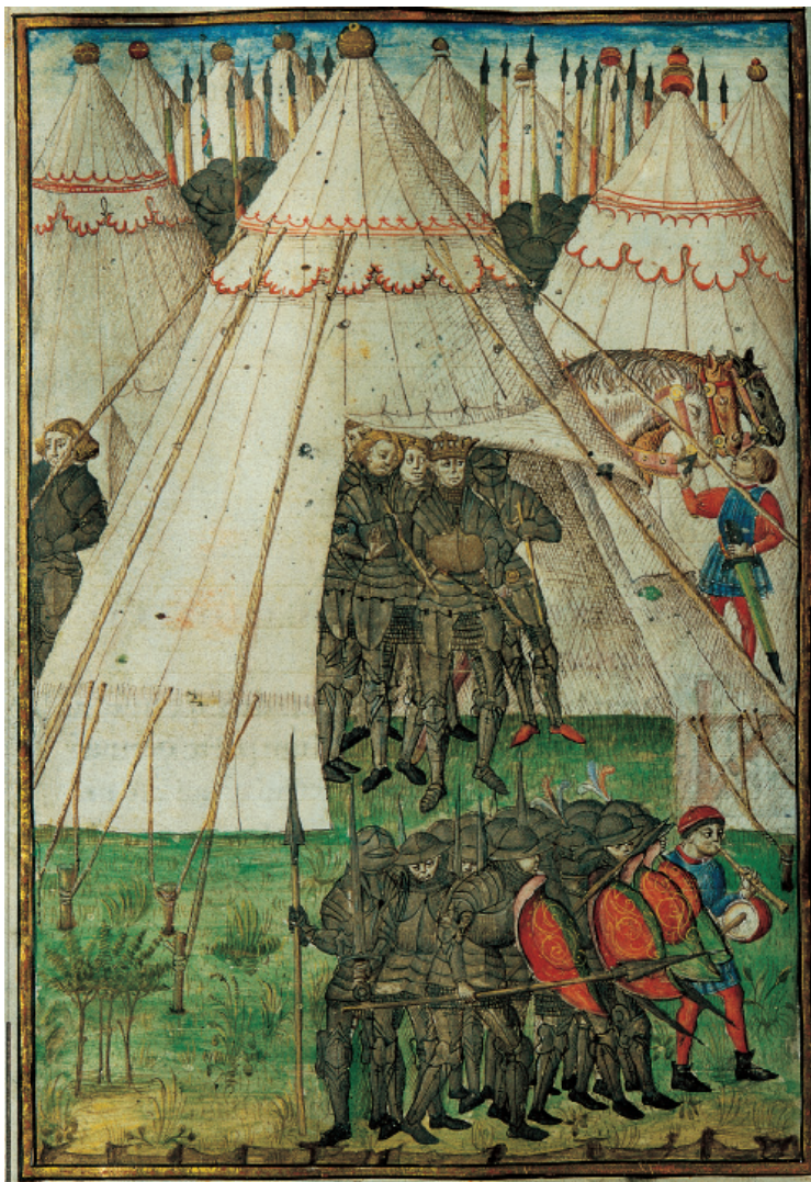
Escena militar d'un campament del segle XIV. L'Eneida (Biblioteca de la Universitat de València). Escena militar de un campamento del siglo XIV. La Eneida (Biblioteca de la Universitat de València).