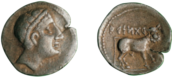
Dracma d'Arse. Principis del segle II a. C. Ø 17 mm. Dracma de Arse. Principis del siglo II a. C. Ø 17 mm.