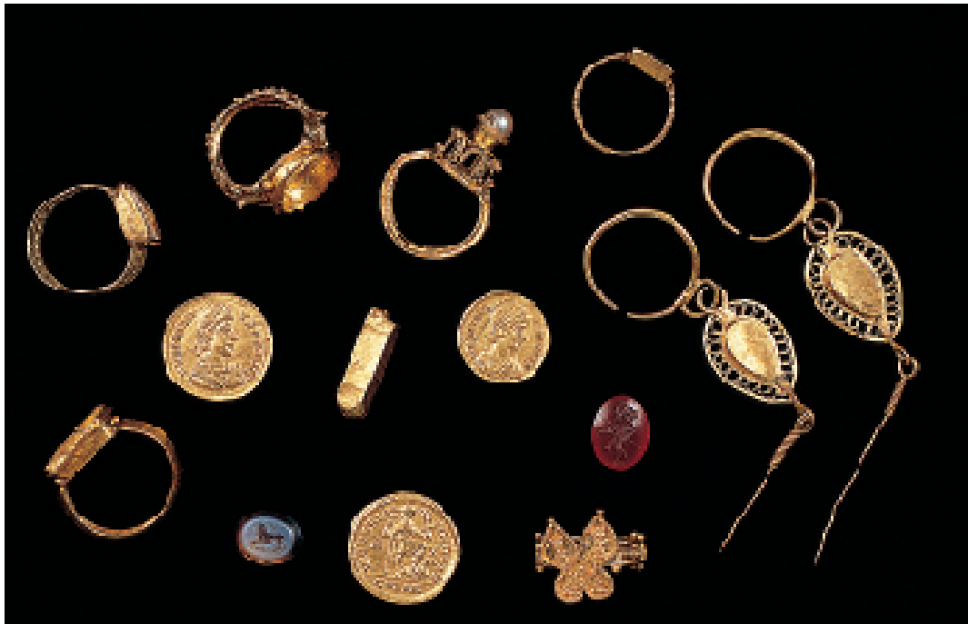
Tresor de l'Alcúdia d'Elx. Tesoro de La Alcudia de Elx.

emissions de Teodosi, Arcadi i Honori representaven la fi de l'abastiment de monedes procedents de l'Imperi, i per això es van mantindre en ús durant els segles següents. Els AE2, que havien sigut desmonetitzats, pareix que es mantingueren en ús el segle v, com es dedueix de la seua presència en alguns tresors com el de la Balsa, i fins al segle vi, com es desprén de les dades arqueològiques i del depòsit monetat trobat al jaciment costaner de la Punta de l'Illa de Cullera.