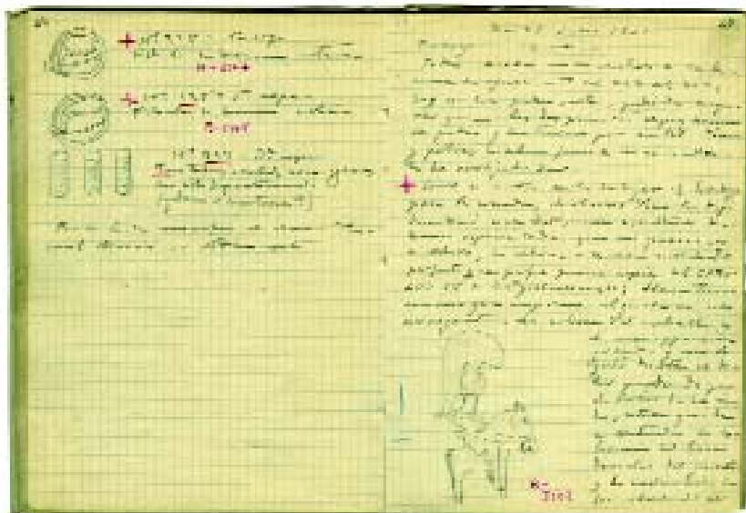
Página del diario de excavación de la Bastida de les Alcusses (Moixent), que recoge la aparición del Guerrer de Moixent. 1931.

1933 se acusa el recibo de un trabajo para el APL aunque renunciaba a publicarlo hasta que M. Gómez Moreno no lo hiciera, según indica L. Pericot a I. Ballester en carta personal el 13 de junio de 1933 (Archivo SIP).