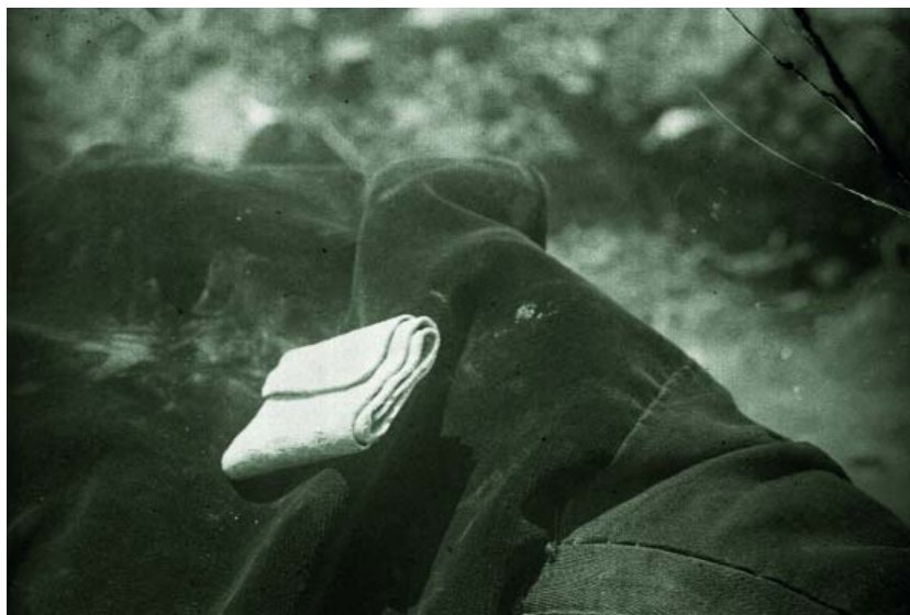
Lámina de plomo en el momento de su hallazgo. 1928. [Casa Grollo. Placa de vidrio. SIP 1.888]

Volvamos al plomo. Su hallazgo era excepcional porque, en primer lugar, podía ofrecer nuevos datos sobre el alfabeto ibérico, exponente de las manifestaciones culturales ibéricas valencianas, pues en 1928 sólo se conocían los plomos escritos del Pujol de Gasset (Castellón), la Serreta (Alcoi-Cocentaina-Penàguila), la Covalta (Albaida-Agres) y unos fragmentos del Cabezo de Mariola (Alfafara-Bocairent) (Ballester, 1929: 18). En una crónica de La Semana Gráfica dos semanas después, el 18 de agosto, I. Ballester ponderaba el hallazgo comparándolo con la plancha escrita de la Serreta —«la reina hasta ahora» decía— que, sin embargo, era más corta en tamaño y sin tanta «riqueza de caracteres». En segundo lugar el plomo había sido hallado con una referencia estratigráfica precisa (cat. 4), como escribe I. Ballester en el diario: «la alegría ha sido general y la suerte y fortuna no para: pues se ha presentado el plomo en condiciones de tiempo y situación tales que ha permitido al sospecharlo por su forma arrollada, tomar toda clase de medidas y datos gráficos, que harán de este plomo el único documento de tal clase al que acompañen datos precisos de su situación. Tomamos otra fotografía de